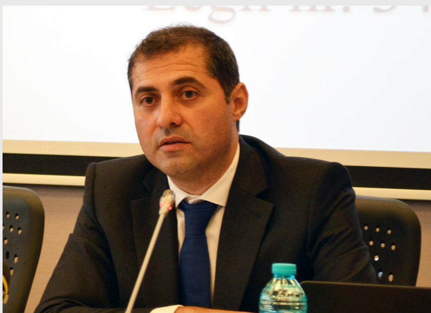
Florin Nicolae Jianu, ministrul delegat pentru IMM-uri, mediul de afaceri și turism