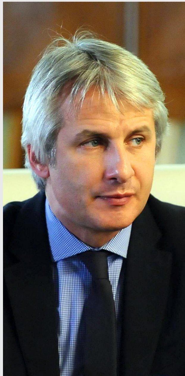
Eugen Teodorovici, ministrul fondurilor europene

În cadrul procesului de selecție Ministerul Fondurilor Europene va avea în vedere reprezentarea echilibrată a domeniilor relevante pentru implementarea fondurilor europene structurale și de investiții, expertiza și experiența, organizațiile selectate urmând să fie implicate activ în coordonarea strategică. Totodată, Ministerul Fondurilor Europene precizează că în cazul în care partenerii economici și sociali sau organismele care reprezintă societatea civilă fac parte dintr-o organizație de tip confederativ general/ sectorial, nu vor fi luate în considerare expresiile de interes transmise in-