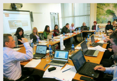
Irlanda, februarie 2014