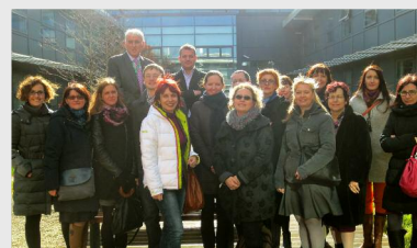
Irlanda, februarie 2014