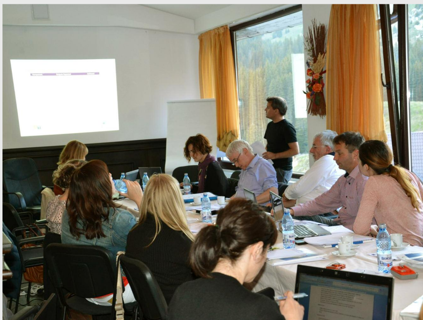
România, mai 2014