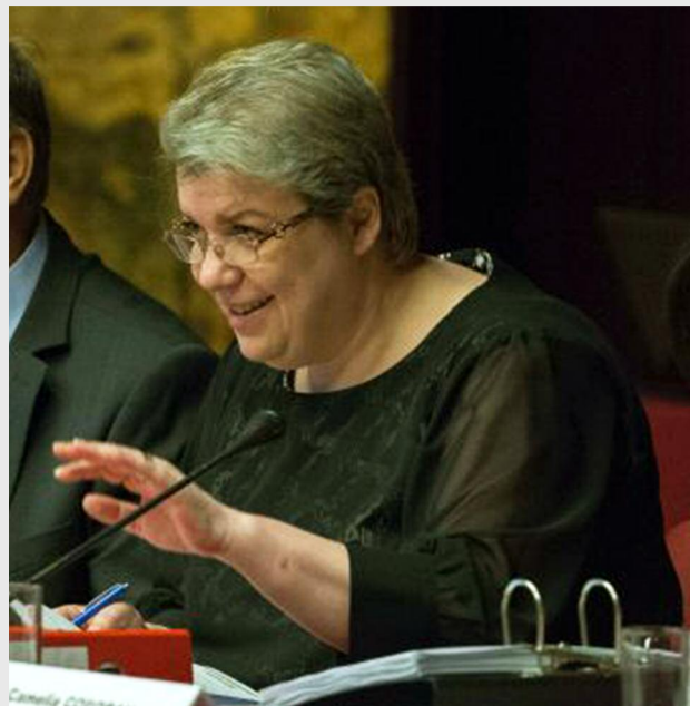
Sevil Shhaideh, ministrul dezvoltării regionale și administrației publice

• Prioritatea de investiții 2.1 „Promovarea spiritului antreprenorial, în special prin facilitarea exploatării economice a ideilor noi și prin încurajarea creării de noi întreprinderi, inclusiv prin incubatoare de afaceri” - Operațiunea Microîntre-