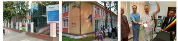
FOTO / A fost inaugurat „Ambulatoriul Integrat al Spitalului Orașenesc Lehliu-Gară,”