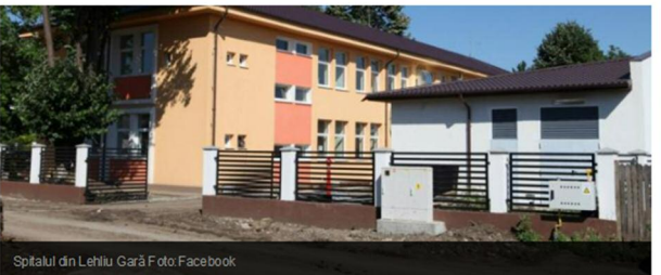
Spitalul din Lehliu Gară

Aboneaza-te la newsletter Adresa ta de email Abonare