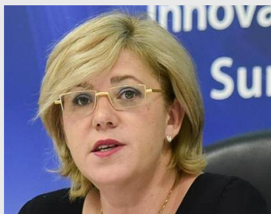
Corina Crețu, comisarul european pentru politică regională

Comisarul european pentru politică regională, Corina Crețu, a avut o întrevedere miercuri, 9 noiembrie, la Bruxelles, cu Radu Boroianu, președintele Institutului Cultural Român. Discuțiile s-au concentrat pe relațiile dintre Institutul Cultural Român și instituțiile europene, precum și pe oportunitățile de finanțare a proiectelor de patrimoniu cultural cu ajutorul fondurilor europene.