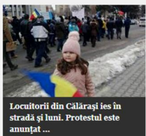
Locuitorii din Călărași ies în stradă și luni. Protestul este anunțat...