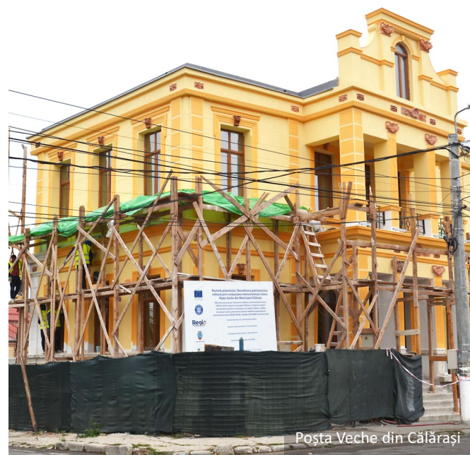
Poșta Veche din Călărași