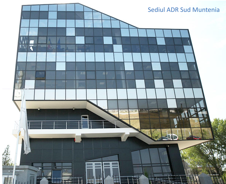
Sediul ADR Sud Muntenia

În cadrul întrunirii vor fi prezentate caracteristicile viitoarei perioade de programare, analiza socio-economică Planului de dezvoltare regională 2021-2027 al regiunii Sud Muntenia, ulterior urmând a fi dezbătută propunerea de Regulament de organizare și funcționare a Comitetului regional pentru elaborarea Planului de dezvoltare regională 2021-2027 al regiunii Sud Muntenia.